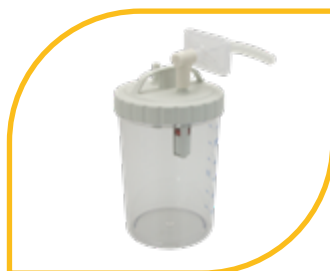
Bocal réutilisable 1200 ml (accessoire).