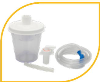
Bocal 800 ml pour patient unique (de série).