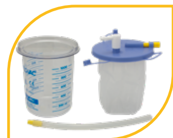
Poche jetable 1000 ml et bocal Flovac réutilisable (accessoires).